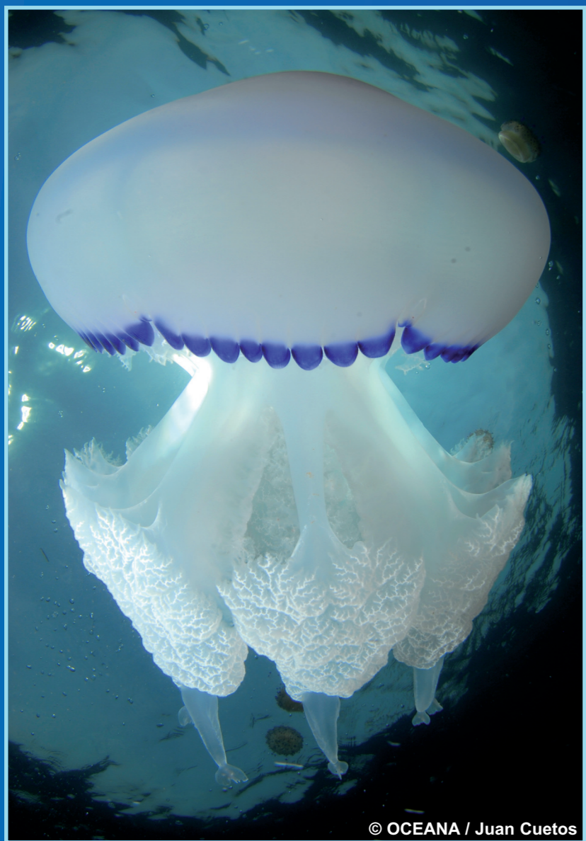
Rhizostoma pulmo , Aguamala Color: Blanco azulado Peligrosidad: Media