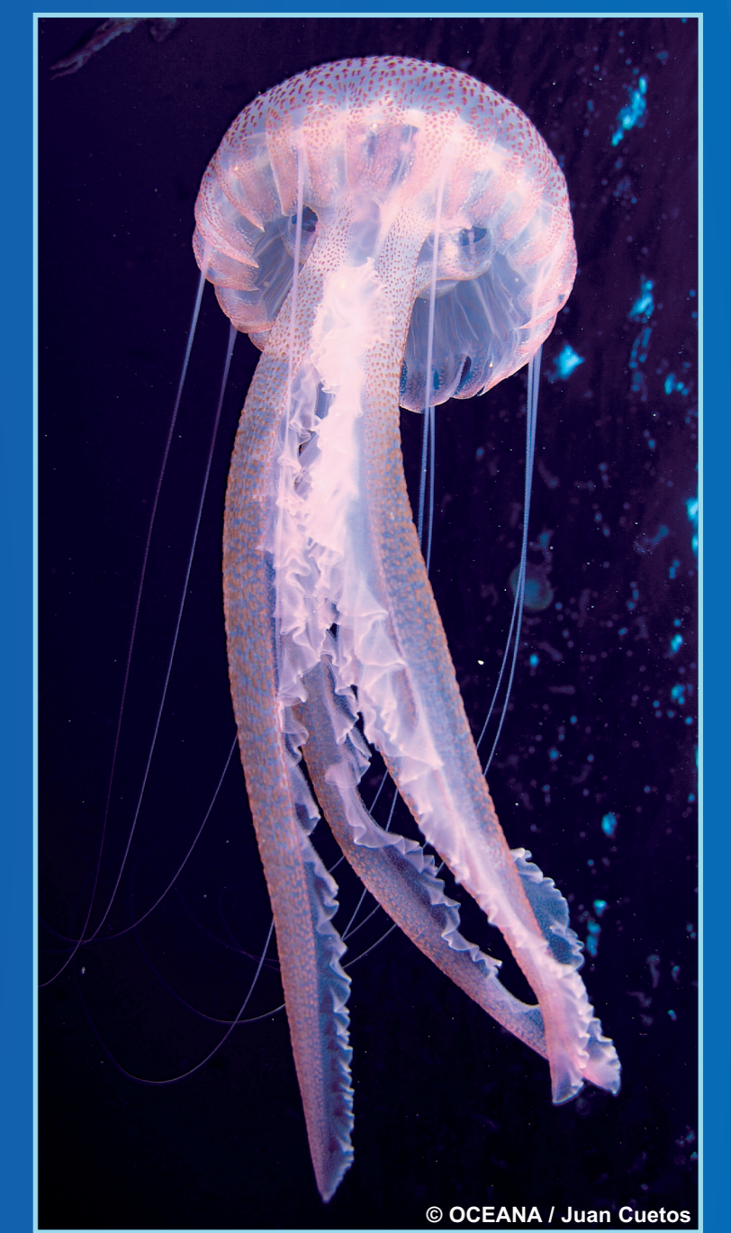
Delagía noctiluca , Clavel Color: Rosa-violáceo Peligrosidad: Alta