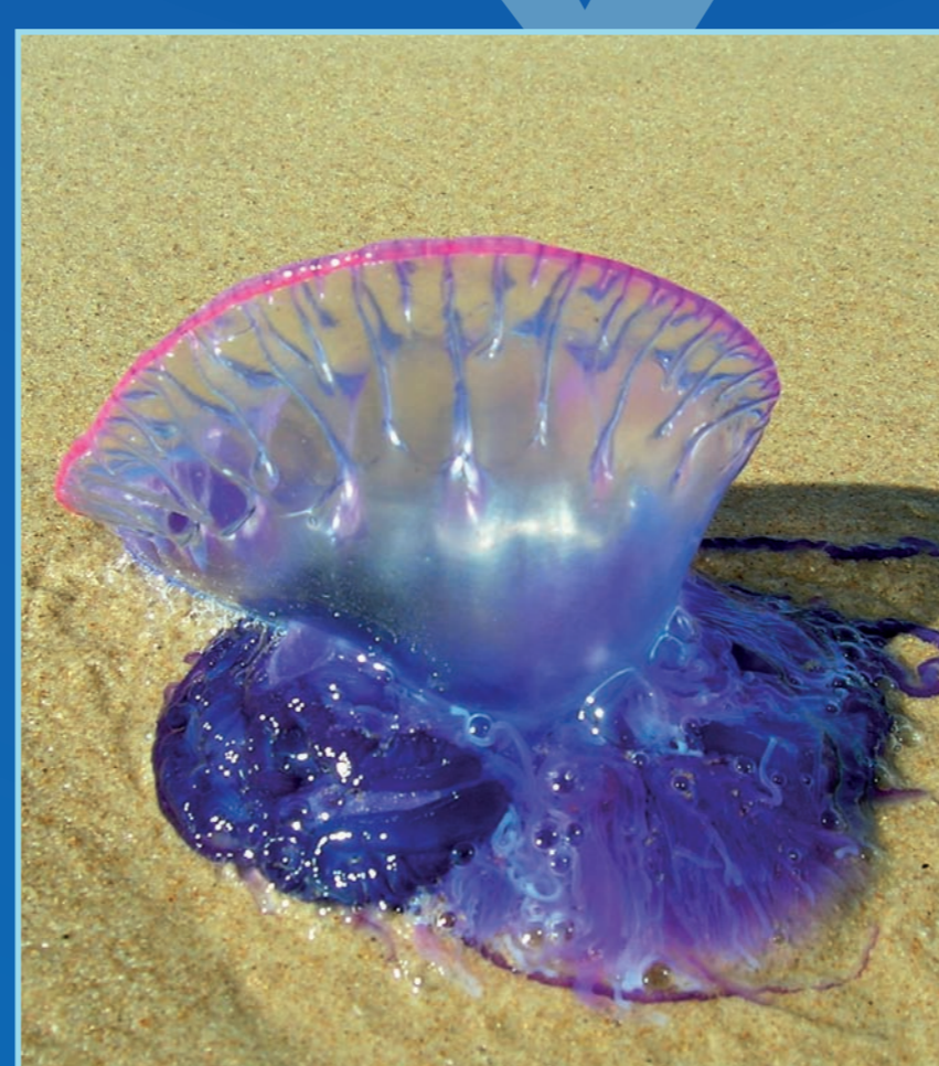
Physalia physalis , Carabela portuguesa Color: Violáceo Peligrosidad: Muy alta