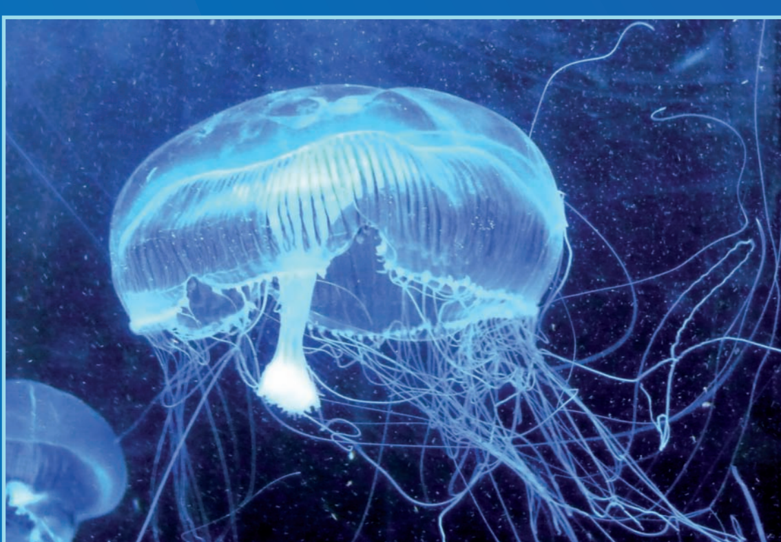
Aequorea forskalea , Medusa Aequorea Color: Transparente Peligrosidad: Ninguna