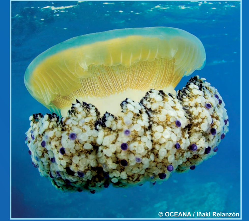
Cotylorhiza tuberculata , Aguacajada Color: Marrón amarillento Peligrosidad: Leve en los tentáculos