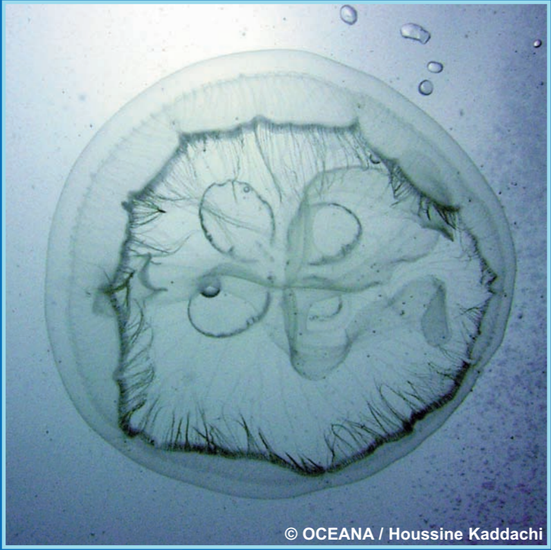
Aurelia aurita , Sombrilla Color: Transparente Peligrosidad: Baja

El objeto de la Campaña Medusas es la vigilancia y avistamiento de la presencia de medusas en las costas españolas, no contemplando la retirada de las mismas. El Ministerio de Medio Ambiente, y Medio Rural y Marino, sólo actuará con carácter excepcional y en situaciones puntuales, de acuerdo a lo establecido en los protocolos de la Campaña.